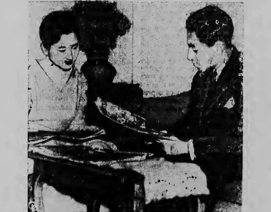
PAREHA IMPERIAL RECIEN CASA NA CAS. — Principe heredero Akihito di Japon y su bruid, antes Michiko Shoda, ta relax aki hunto den un sala di su palacio na Tokio...

„Da buske caba na Texas, senjor Wilson? Sempër Dennis ta papia di su viahe pa Texas!”